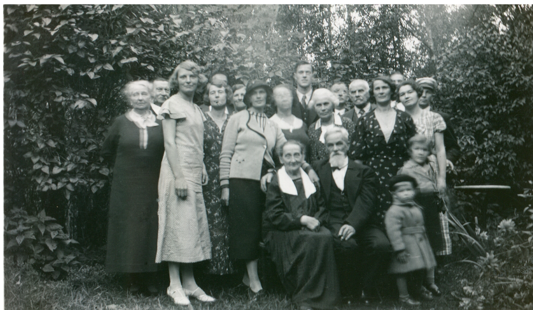
På Vendelsö troligen 1936 på bröllopsdagen.