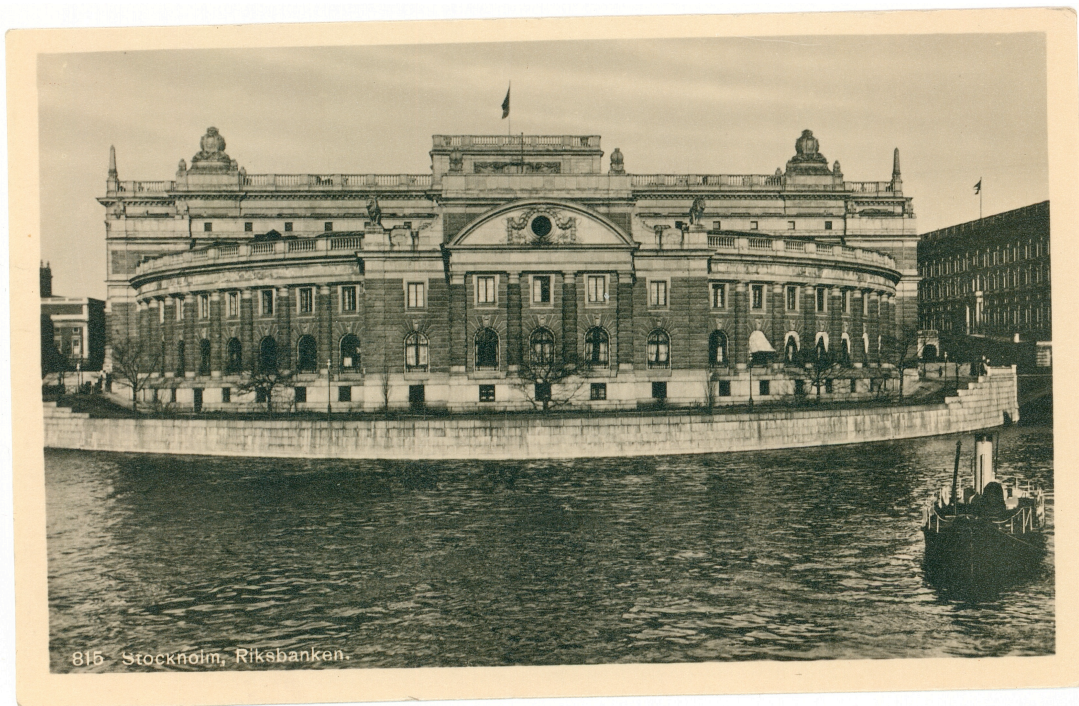
"Nya Riksbanken". Tjänstebostaden låg i bottenplanet till vänster på bilden med utsikt mot strömmarna.