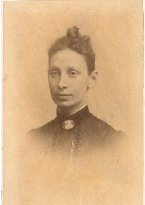
Sofia nyinflyttad till Riksbanken