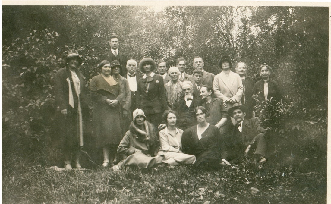
På Vendelsö omkring 1930.