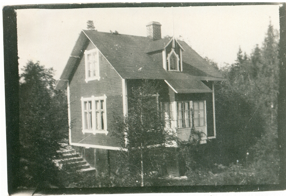
Sofiehill, Vendelsö som sommarstuga före tillbyggnad.