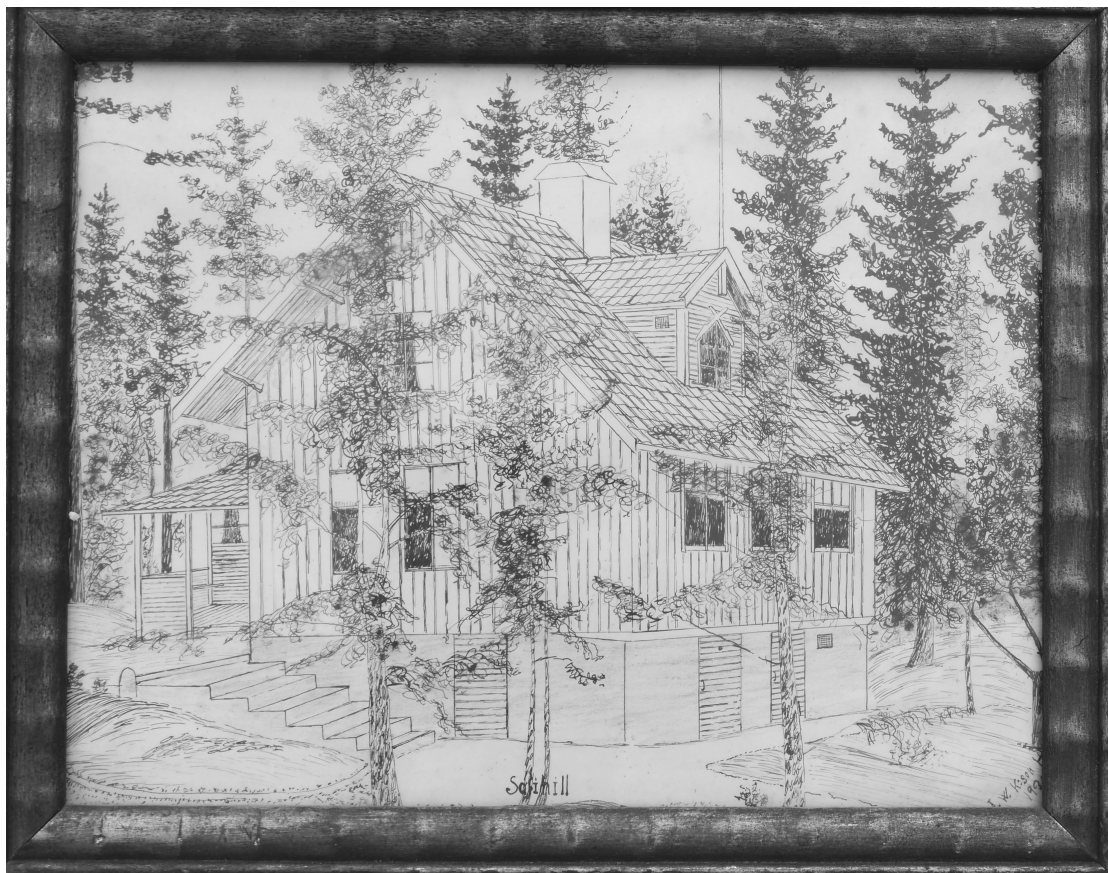
Sofiehill i slutlig skepnad. Foto av teckning, som alla barnen fick.