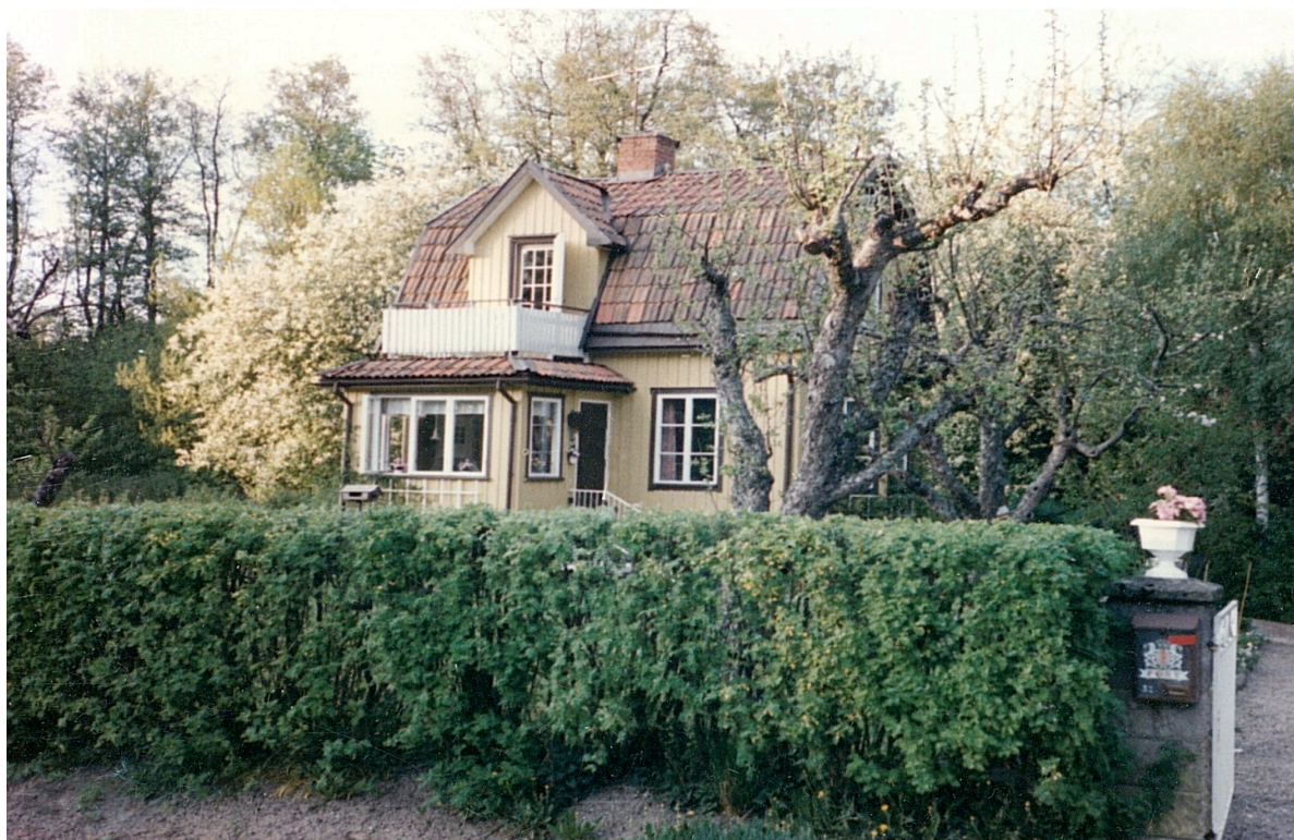
Elin och Valles hus i Vendelsö. Kortet taget 1990.